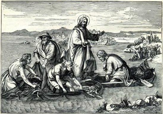
Х. Чудесный ловъ рыбы.