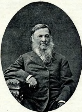
Н. И. Ильминскій.

Вообразите наше удивленіе, когда мы остановились. На возвышенномъ бугоркѣ, гдѣ было посуше, разостлалъ пледъ, а на немъ сидѣла дѣвочка лѣтъ 3-хъ, необыкновенно замѣчательной красоты.